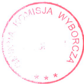
Pieczęć Gminnej Komisji Wyborczej w Dolsku