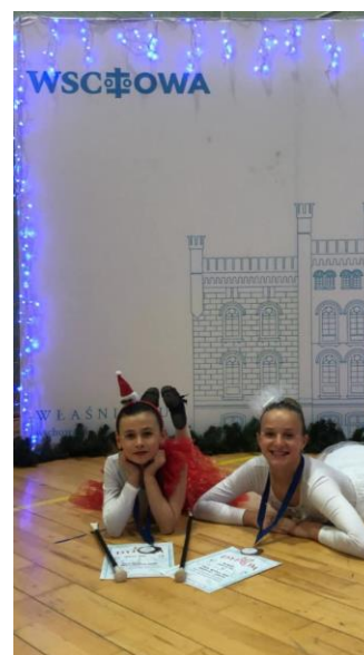
Fot. Mażoretki LKS Zawisza Dolsk