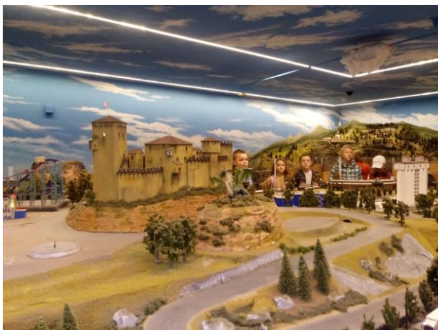
Fot. Szkoła Podstawowa im. J. Kusocińskiego w Dolsku

W Kórniku piątoklasiści przeszli Promenadą im. Wisławy Szymborskiej do ostatniego punktu wycieczki, jakim był Zamek. Z zacięciem wysłuchali historii tego niezwykłego miejsca i z uśmiechem na twarzy wrócili do Dolska.