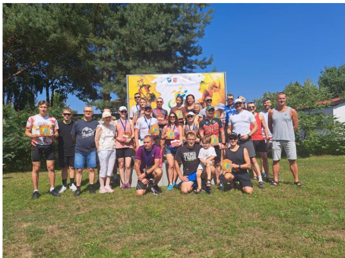
Fot. Miejsko-Gminny Ośrodek Sportu i Rekreacji w Dolsku