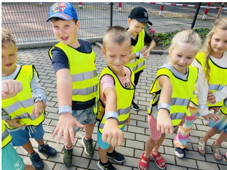
Fot. Zespół Przedszkoli w Dolsku

Policjanci przeprowadzili z dziećmi rozmowę dotyczącą zasad bezpieczeństwa. Uczestnicy spotkania mogli również obejrzeć policyjny motocykl i radiowóz, co bardzo im się spodobało. Na zakończenie każde dziecko otrzymało odbłask. Z kolei przedszkolaki, w podziękowaniu za przeprowadzone zajęcia, wręczyły przedszkolną stokrotkę.