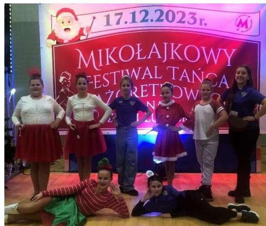
Fot. Mażoretki LKS Zawisza Dolsk